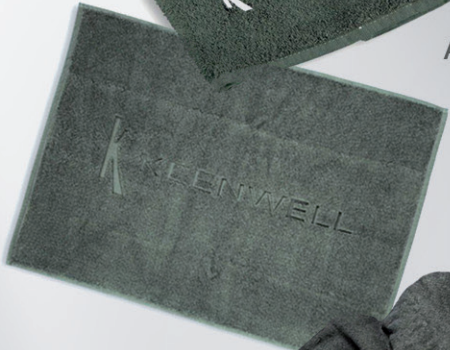
ALFOMBRA / CARPET 50x70 cm / 800 gr.mq. Algodón / Cotton Ref: K2014034