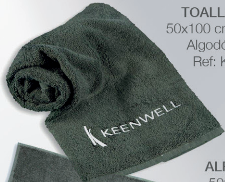
TOALLA / TOWEL 50x100 cm / 500 gr.mq. Algodón / Cotton Ref: K2014035