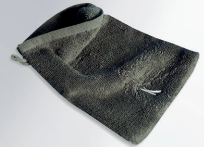
MANOPLA / MITTEN 15x22 cm / 400 gr.mq Algodón / Cotton Ref: K2014032