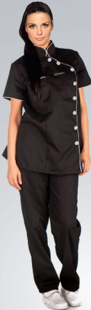
UNIFORME / UNIFORM Diferentes Tallas / Different Sizes Algodón+Poliéster / Cotton+Polyester Talla S Ref: K2014026 Talla M Ref: K2014027 Talla X Ref: K2014028 Talla XL Ref: K2014029