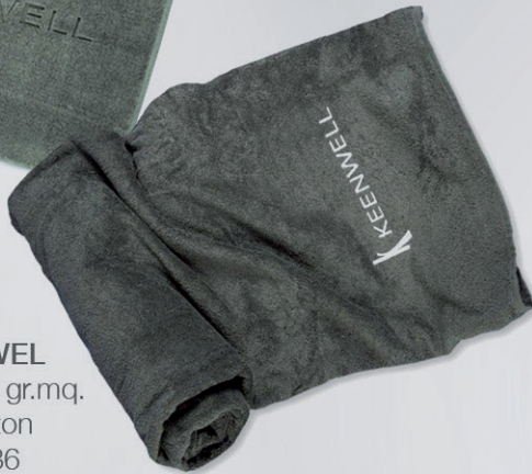
TOALLA / TOWEL 100x200 cm / 500 gr.mq. Algodón / Cotton Ref: K2014036