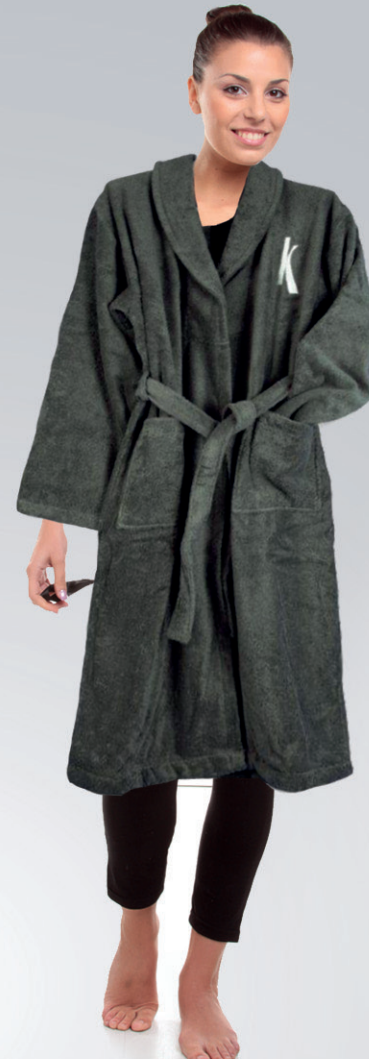
ALBORNOZ / BATH ROBE Talla única / Single Size Algodón / Cotton Ref: K2014031